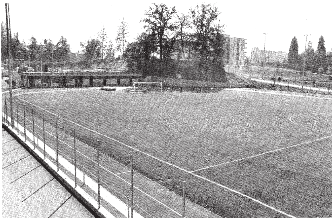
Il campo di calcio del Centro sportivo di Val Gersa dei Comuni di Massagno e Savosa in territorio di Savosa.