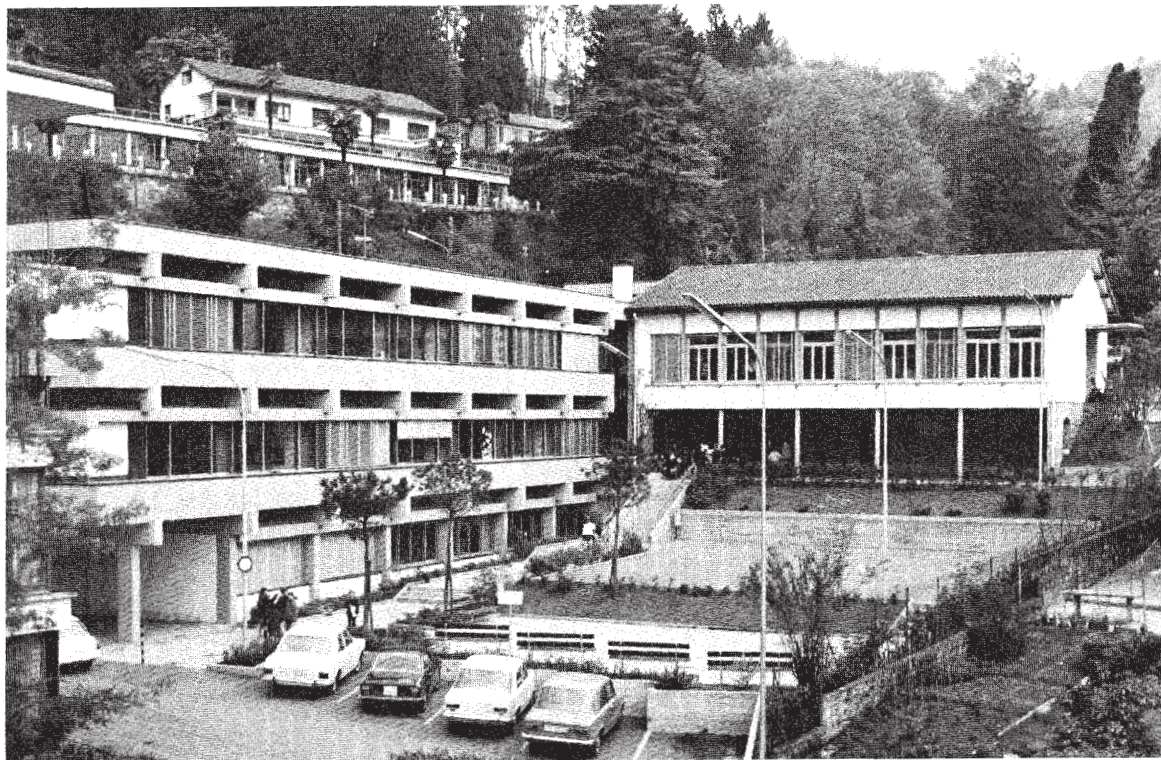
Il nuovo centro scolastico a Crocifisso di Savosa.