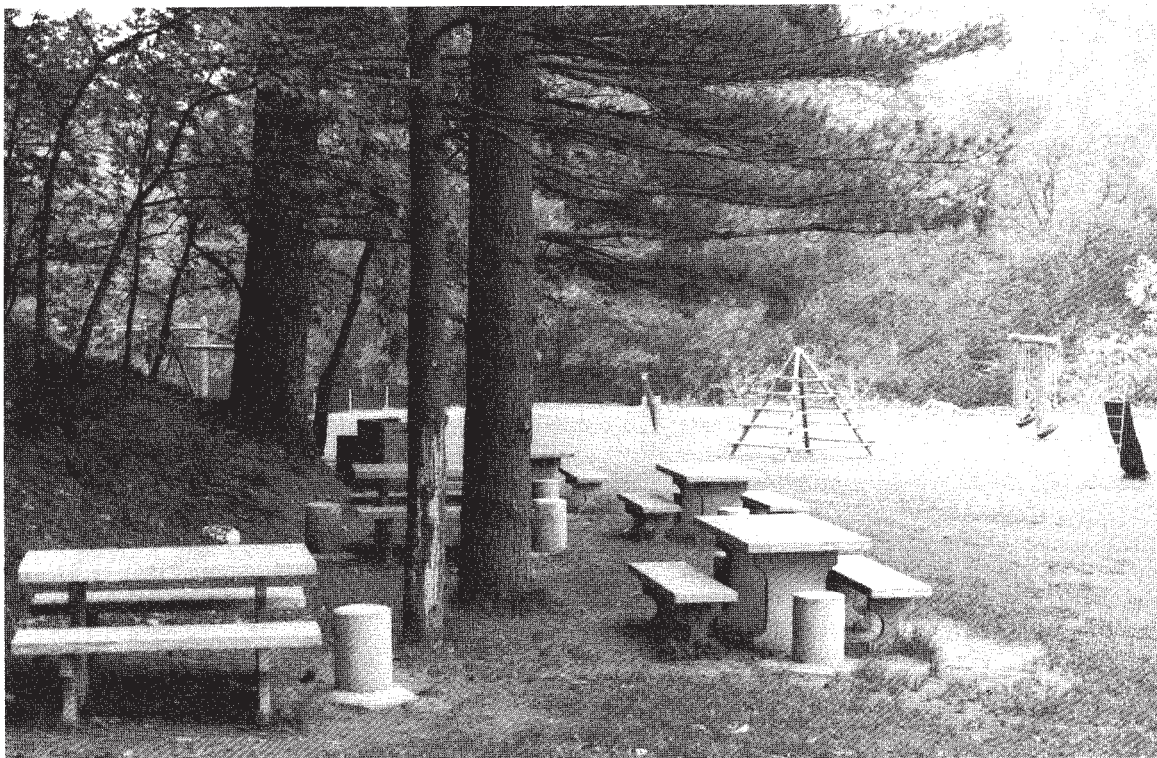
Il parco di giochi e svaghi sulla Via Vira, ai piedi del bosco «Alva» con un campo di calcio.

1978-1980: Costruzione del CENTRO SPORTIVO CONSORTILE DELLA VAL GERSA fra i Comuni di Massagno e Savosa che comprende una superficie di mq. 30.000.